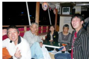
鵜飼観覧船の中です

10月1日~2日、利用者さん4名、職員2名の6名で、岐阜・名古屋方面に出掛けました。前日まで台風の心配をしていましたが、みんなの思いが台風を吹き飛ばし快晴の空の下での旅行となりました。1日目は金華