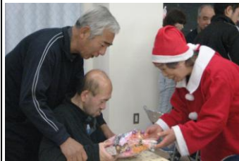
理事長サンタにお菓子をいただくMさん