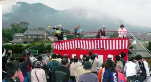
としなが祭の最後を飾る「もち投げ」