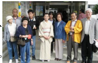
無門学園の施設長さんと一緒にパチリ

11月2日、豊田市の無門学園さんのおまつり「むもんまつり」に利用者さん3名と出掛けました。オープニングはピタゴラ流しそうめんという楽しい企画で始まり、さっそく模擬店会場へ。お店の種類の多さにびっくりです。その一例を挙げますと「天丼」「おしるこ」「焼き鳥」「焼きしいたけ」「焼き栗」「フランクフルト」「焼きそば」「杏仁豆腐」「おへちゃ汁」そして「生ビール」まだまだいっぱいありましたが書ききれません。野菜やクッキーなどの自主製品もたくさんありました。利用者さんにとってはとにかくたくさん食べ大満足、職員はおまつりについての勉強ができた充実のひと時でした。(山口香子)