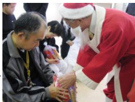
お菓子をいただくＴさん