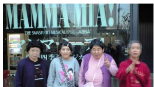
名古屋ミュージカル劇場の前にて

12月10日、トヨタL&F中部株式会社様の招待を受け、ミュージカル「マンマ・ミーア」を観劇してきました。ミュージカルは初体験の方ばかりで、ドキドキしながら出かけました。現地に到着すると緊張がピークに、ついたとたん泣き出してしまふ方もみえましたが、始まるまでには環境にも慣れ、落ち着いて観ることができました。始まるとみんなステージに釘付け。幕間では「どうなるの?」「あの人は?」など、内容をしっかり理解できていました。後半も集中力は続き、ミュージカルを満喫することができていました。最後に、観劇にご招待いただきました、トヨタL&F中部株式