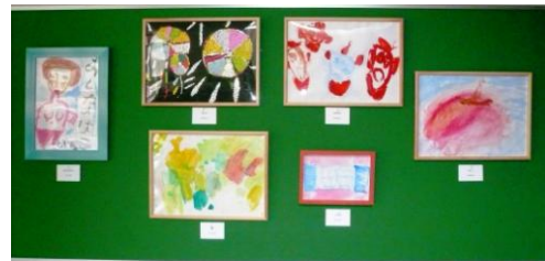
出品作品です。ホタルの郷事務所前の廊下に展示してありますので、見に来てくださいね。

愛知県知的障害児者生活サポート協会が主催する「ふれあいアート展」に、ホタルの郷からも6名出品しました。惜しくも受賞は逃しましたが、初めて絵を出品し、いろいろな方に見ていただくという経験が利用者さんにとって誇らしい思い出になりました。