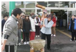
利用者さんと一緒に餅つきをする理事長