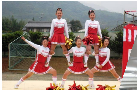
豊川高校チアリーディング部