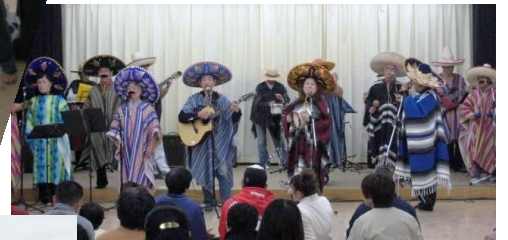
メキシカンサウンズの演奏