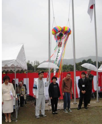
利用者さん代表によるくす玉割り

式典のあと、豊川高校チアリーディング部のチアリーディングで、会場を一気に盛り上げていただき、ブア・アロ・アロのフラダンス、夢太鼓の和太鼓演奏、メキシカンサウンズの演奏などの催し物で、大盛り上がりでした。