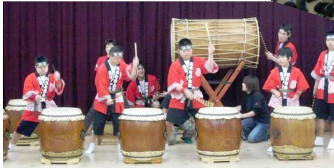
夢太鼓の和太鼓演奏