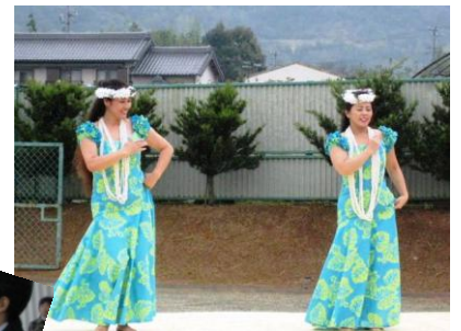
ブア・アロ・アロの皆さんによるフラダンス