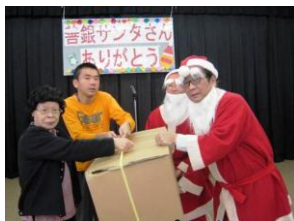
サンタさんからプレゼントをいただく自治会長と副自治会長

12月11日、一足早い善銀サンタさんが、ホテルの郷にやってきました。プレゼントは一人ひとり手渡していただき、握手をしてもらったり、お礼を言ったり、皆さんとても喜んでいました。