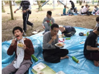
戸外で食べるお弁当って、どうしてこんなにおいしいのでしょうか

5月3日と6日に春季お楽しみ外出を行いました。ゴールデンウィークの帰省がままならない利用者さんを中心にお弁当をとって大木ちびっ子広場へ出かけました。