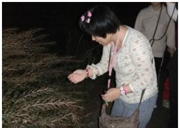
ホテルにさわられるかな!?

当日は天候も良く、日が沈むと同時にたくさんのホテルを見ることができました。ホテルを怖がらずにつかまえようとする利用者さんもいたりして、楽しい時間を共有することができたひと時でした。(栗田宜幸)