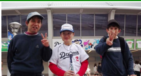
ナゴヤドームの前で、ピースサイン

4月19日、中日対巨人の試合を利用者さん3名、職員1名で観戦してきました。名鉄と地下鉄を乗り継ぎ、ナゴヤドームへ。野球大好きな3名はドームが見えると興奮がMAX状態に。見ず知らずの方にも肩を叩き声を掛け、喜びを表現していました。