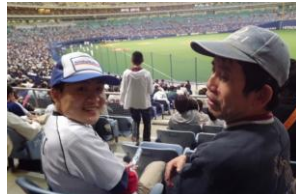
常にニコニコ笑顔

試合前に夕食を済ませ、観戦グッズも準備し、いざドーム内へ。ものすごく真剣な眼差しで観戦していた