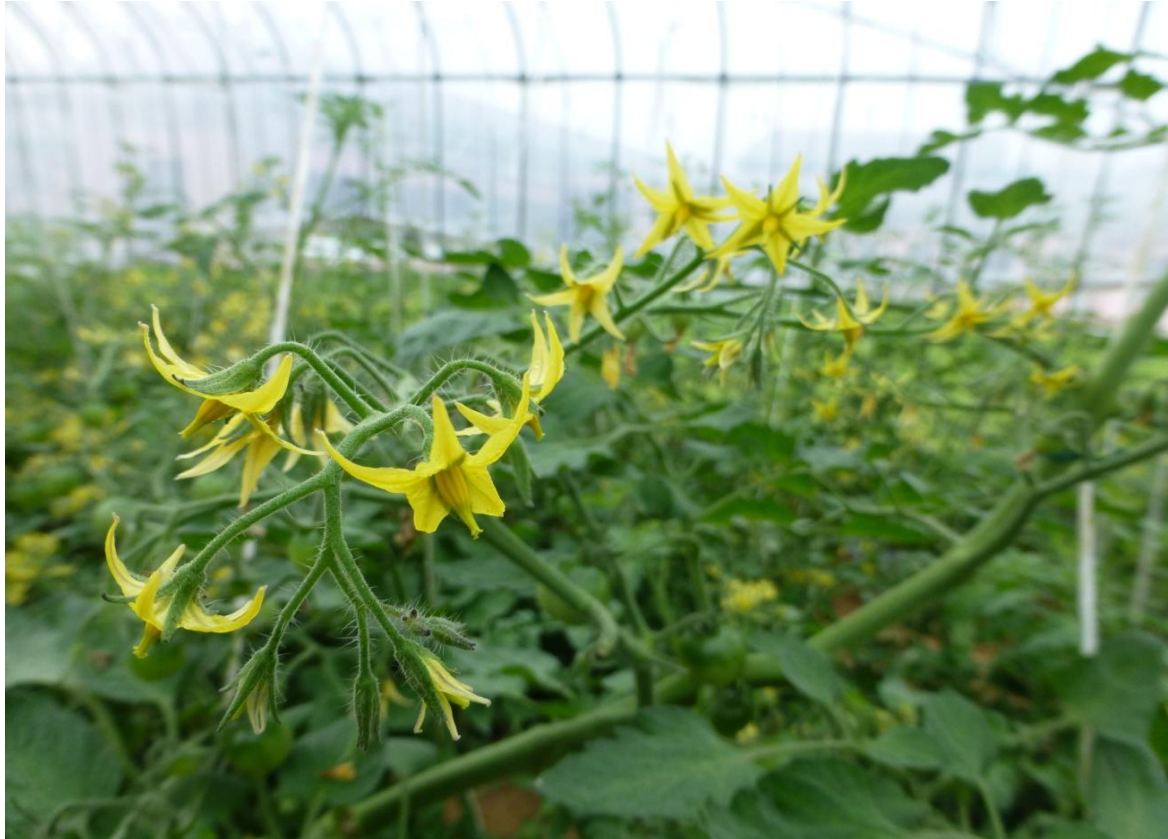
写真：ミニトマトの花