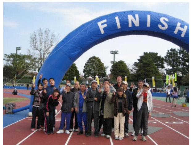
全員完走おめでとう！