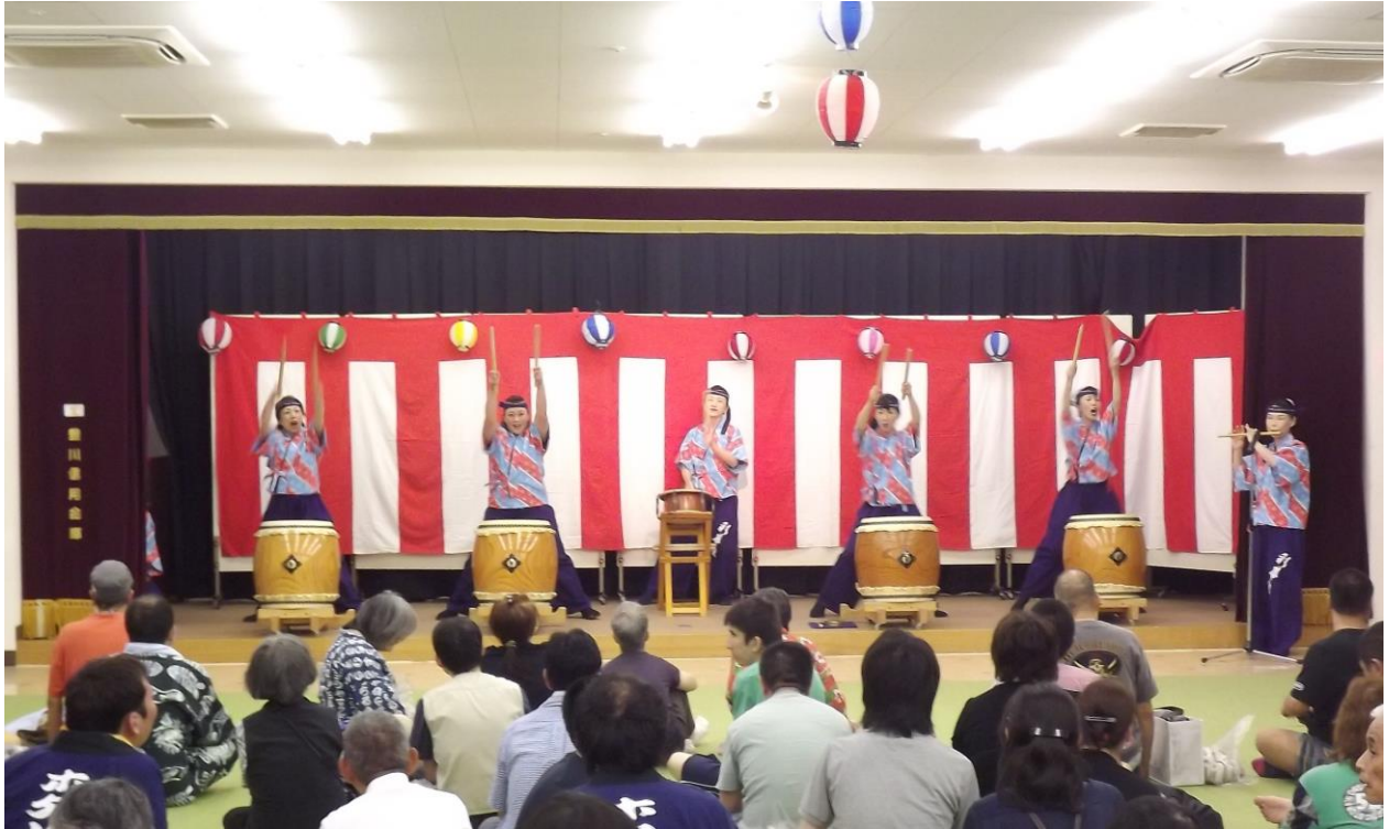
彩華（はな）組の皆さんによる和太鼓の演奏

8月9日、納涼まつりを開催しました。今年、天候に恵まれず、室内での開催となりましたが、地域の方やボランティアの方のご支援・ご協力のおかげで狭いながらも、盛大に執り行うことができました。ありがとうございました。