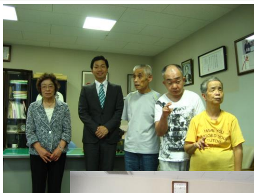
左から 小林理事長・澤田店長様 ・利用者さん