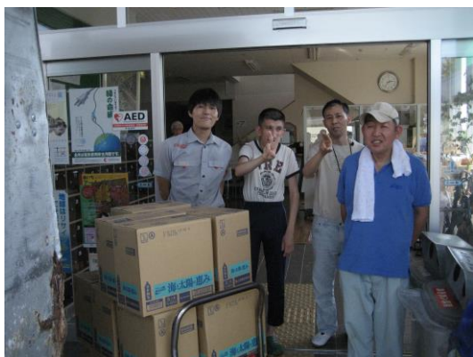
たくさんのジュースをありがとうございます!!

9月16日にコカ・コーライーストジャパン株式会社様より清涼飲料水の寄贈がありました。利用者さんたちは、満面の笑みで「やった～。ジュースだ～!!」と喜んでいました。頂いた清涼飲料水は、給水タイムやおやつタイムなどで頂いており、「たくさん飲みたいなあ。」「コップにいっぱい入れて～」と毎日の給水タイムを楽しみにしています。