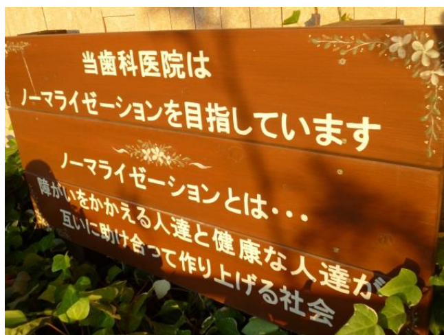
木下歯科医院様にある看板です。