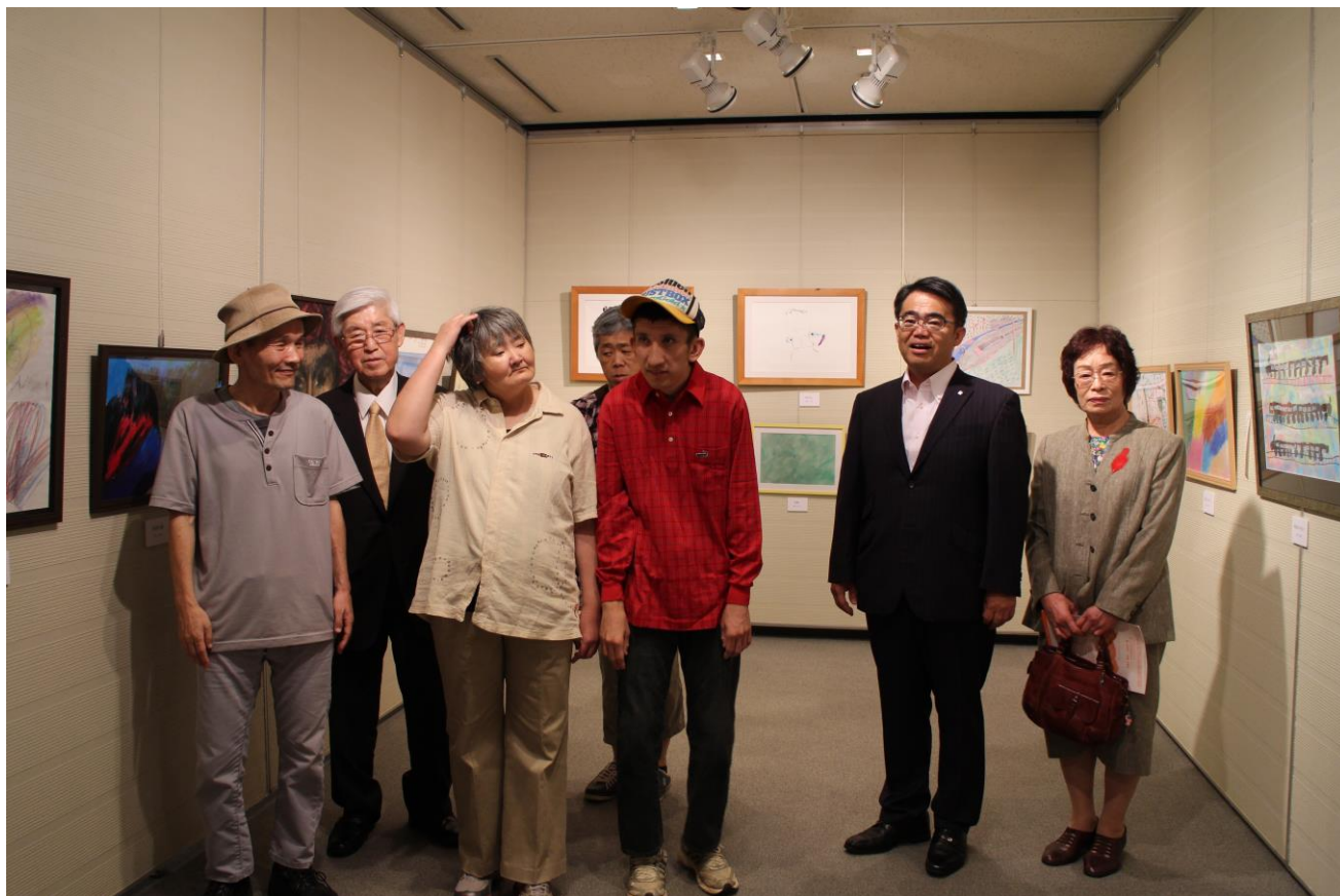
「第7回ふれあいアート展」会場にて大村秀章愛知県知事と記念撮影