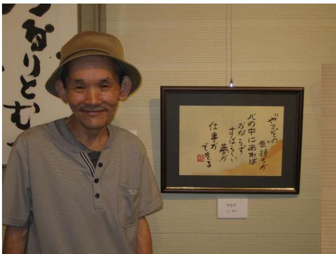
HさんとHさんの作品