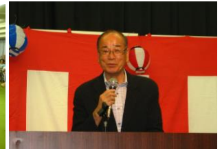
鈴木克昌衆議院議員