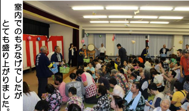
室内でのもちなげでしたがとても盛り上がりました。