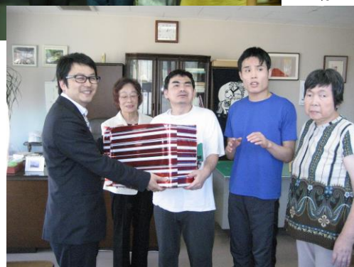
左から 石倉店長代理様・小林理事長・利用者さん