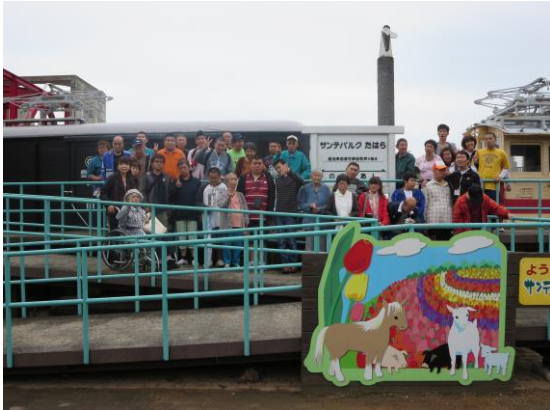
来年は晴れますように！と願いながらみんなで記念

10月9日にサンテパーク田原へバスハイクに出かけてきました。あいにくの雨でしたが（3年連続雨）現地に着くと小雨になり、お弁当を食べてから、それぞれグループに分かれて散策や遊具で遊んだりしました。