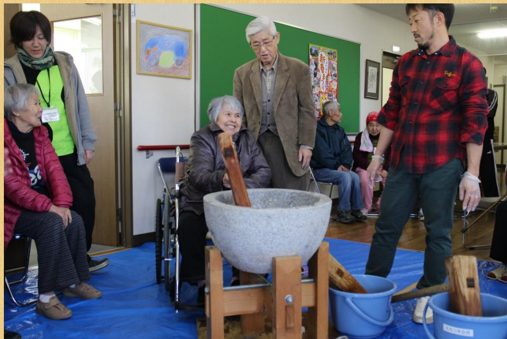
写真：平成27年1月8日 もちつき会