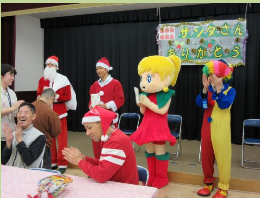
マドンナグランプリ様いつもありがとうございます