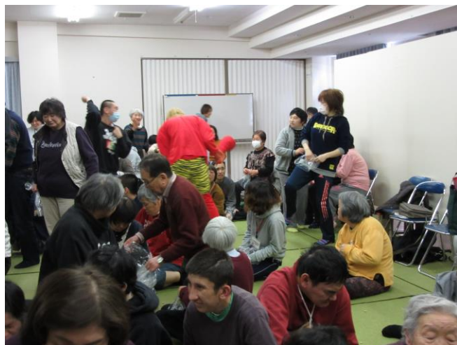
「鬼をやっつけるぞー!!」