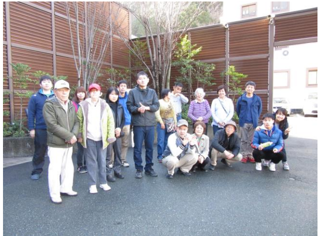
「みんなで記念撮影(^_^)v」

3月7日にホテルの郷とすまいるの合同で利用者さんと保護者、職員の総勢113人で安城産業文化公園デンパークへ出掛けました。天気は、あいにくの曇り空でした。到着してからは、親子水入らずで昼食をとったり、園内を散策し色とりどりのお花を見たりと、皆さん自由な時間を過ごしていました。園内は広いので良い運動になったかな？親子ふれあいデーに参加させていただき感じたことは、どの利用者さんもととても嬉しそうな顔をしており、家族と過ごす時間の大切さを知りました。