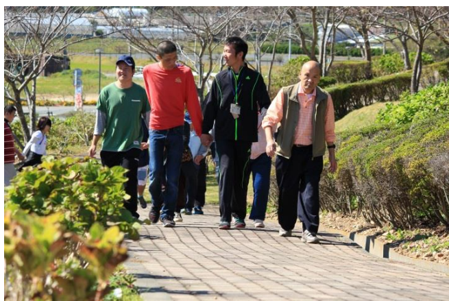
良い天気で気持ちがいいな～(^O^)