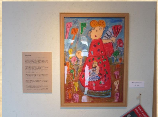
華麗なるジャポニスム展のチラシの模写

10月6日、電気文化会館で第8回ふれあいアート展授賞式に参加するため T さん、Y さんと共に外出しました。