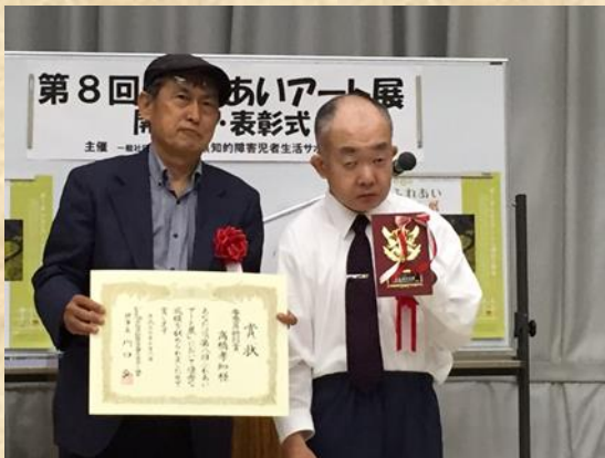
受賞おめでとうございます。