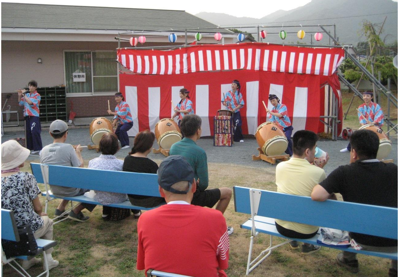
はな 彩華組の皆さんによる和太鼓の演奏

8月8日、恒例の納涼まつりが開催されました。今年は、天候に恵まれ多くの来賓の方やお客さんが例年以上に来場してくださいました。ありがとうございました。