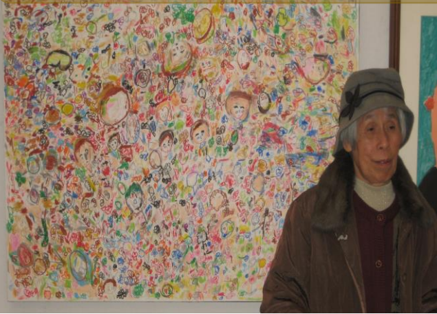
YさんとYさんの作品です。

12月6日名古屋市民ギャラリー矢田で開催されたあいちアールブリュット展にホテルの郷の利用者さん2名と職員で見学に行きました。