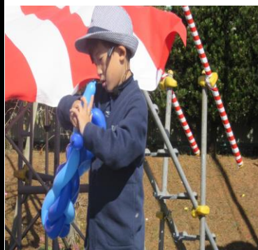
パフォーマーキア

第一部の式典では、永年勤続職員2名に感謝状が贈呈されました。その後、利用者さん代表によるくす玉割りで、としなが祭が開幕しました。