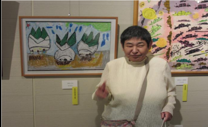
入賞おめでとうございます。

10月2日に、ふれあいアート展授賞式に出席する為、名古屋へ利用者さん2人と職員1人で外出しました。