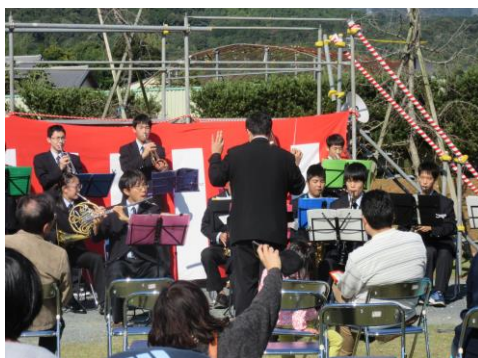
豊川工業高校吹奏楽部