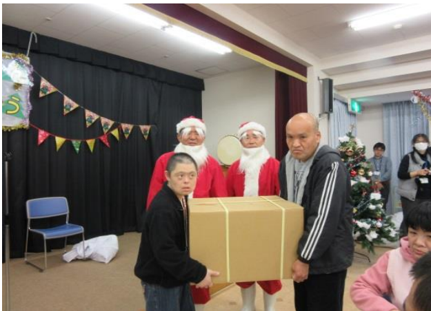
善銀サンタさんありがとう！

12月9日に、一足早く善意銀行のサンタさんがやってきました。サンタさんからお菓子のプレゼントをもらい利用者さんの笑顔がたくさん見ることができました。お菓子をもらおうとお腹が空いてしまいたくさん食べている人もいました。