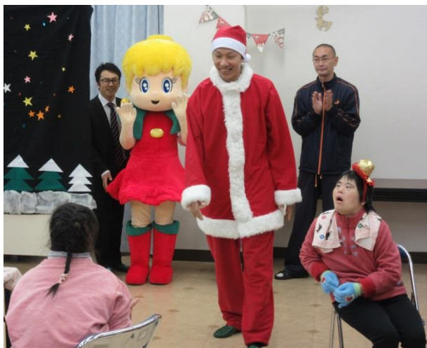
マドンナグランプリさん いつもありがとうございます