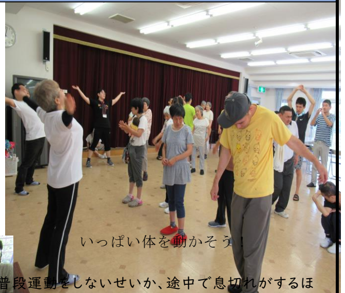
いっぱい体を動かそう

7月30日、第一興商から音楽レクリエーションのインストラクターの方が来所しました。不定期で来ていただいているので今回で2回目のレクリエーションです。なじみのある炭坑節や童謡に合わせて手を振ったり、リズムに乗って足を動かしたりなどしました。