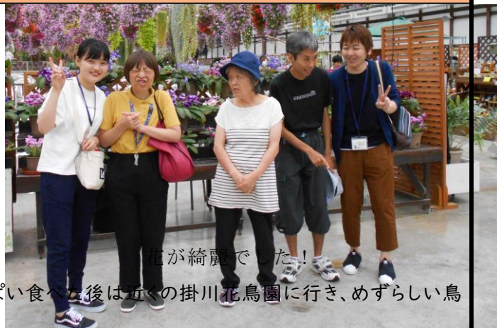
花が綺麗でした！ お腹いっぱい食べた後は近くの掛川花鳥園に行き、めずらしい鳥

を見たり、エサをあげる部屋では、1羽にエサをあげると他の鳥もたくさん近づいてきて、急に肩に乗ってくる事があり驚きました。様々な鳥とふれあう事ができ、とても楽しめたと思います。天候があまりよくなかったですが、いつもとは違う日常になり、楽しく外出できたのでよかったです。