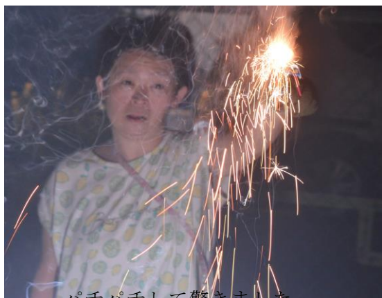
パチパチして驚きました。

今回は風がなかったため、辺り一面が顔も見えないほど花火の煙で覆われてしまいましたが、花火観賞会は今回3回目という事もあり、利用者の皆さんも慣れた手つきで花火を扱い、楽しむことができました。夏の終わりに良い思い出を作ることができました。来年も利用者さんが楽しめるように、考えていきたいと思ひます。