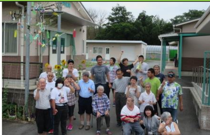
願いが叶うといいな～。

7月5日、すまいるでは七夕の準備をしました。今年も例年通り笹を用意し、利用者さんと一緒に折り紙を使っている色々な飾りを作りました。中には楽しみで自分で飾りつけを作ってくれた利用者さんもいました。飾りと短冊をつけた後にみんなで集合写真を撮りました。みんな願いが叶ったかな？