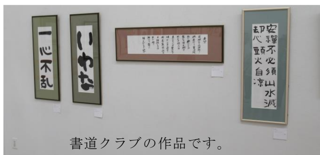
書道クラブの作品です。