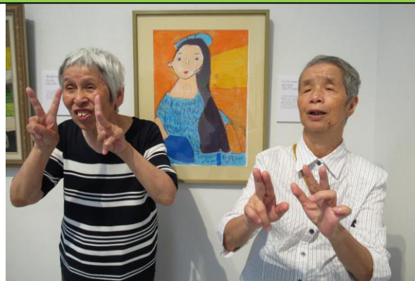
自分の作品の目の前で記念撮影。

ラブの作品を中心に出品しました。見学中は、猫が描かれた作品を見て、「猫がいるね。」や、馬がモチーフの作品を見て、「馬がいるね。」など楽しみながら見る事が出来ました。