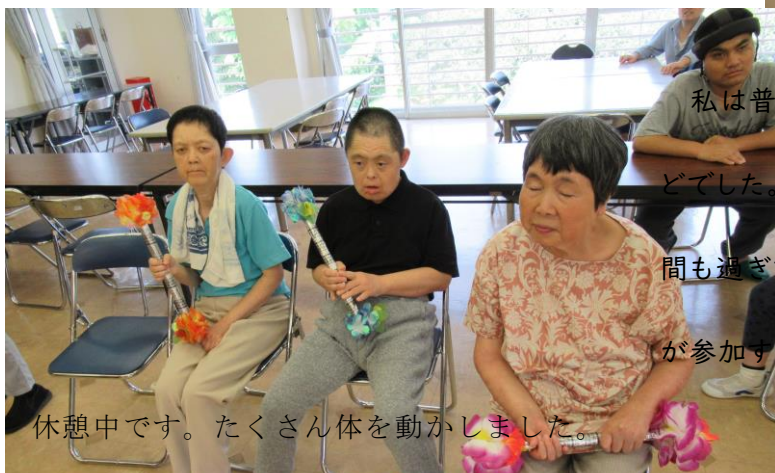
休憩中です。たくさん体を動かしました。

私は普段運動をしないせいか、途中で息切れがするほどでした。利用者さんは楽しく過ごす中でいつの間にか時間も過ぎているようで、皆笑顔でした。今後も不定期ですが参加するのが楽しみです。