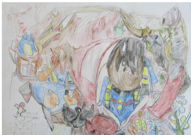
すまいる利用者 T・Tさんの作品

2022年1月18日から、ワークス岩西さんのパンとカフェ 公園通りにて、ホテルの郷とすまいるの利用者さんの作品展示を行いました。