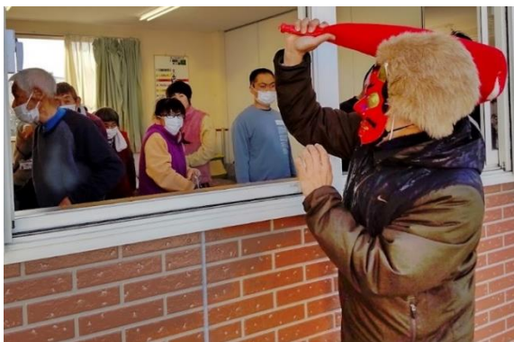
キャー鬼が来たー！！