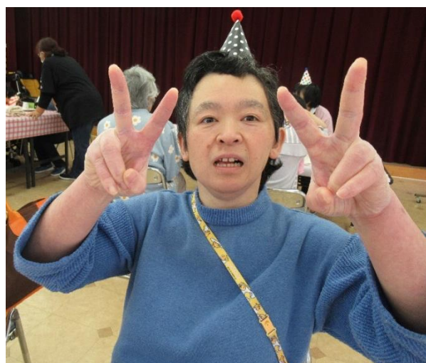
おやつパーティー最高～ ✨ ✨

3月29日におやつパーティーを開催しました。新型コロナウイルス感染対策の為、手指消毒、換気をしっかり行い開催しました。