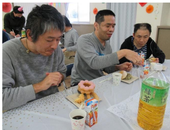
🍩 ドーナツに夢中です 🍩