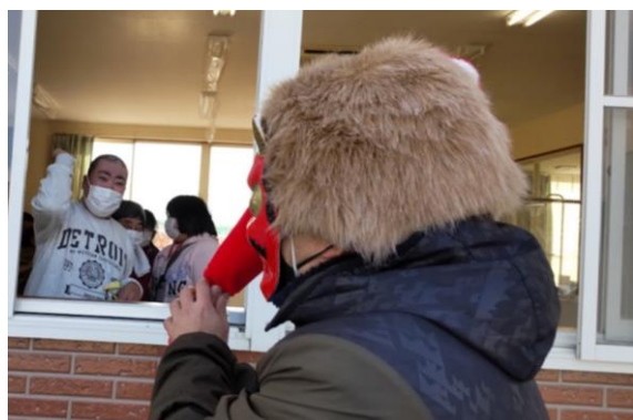
🍡に勇敢に立ち向かいます！

2月2日、すまいるでは豆まき会を行いました。新型コロナウイルスの感染拡大の影響のため、昨年の豆まき会よりも小規模なイベントとなりました。